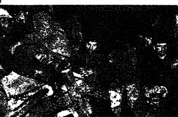
العمال المضربون في إحدى طبقات المنجم وقد بدوا في حالة سيئة.

تمكروا في طوكيو قالت مصادر نفطي امس الاثنين ان الحكومة حثت شركات النفط اليابانية على خفض كميات النفط التي تستوردونها من ايران نتيجة للضربة التي اقترحتها حول كتاب رشدي. وقالت المصادر ان طوكيو قد تعرض لديها بسبب استيرادها كميات كبيرة من النفط من ايران. في موسكو تمكن حوالي ١٥ شخصاً من التظاهر امس الاثنين ضد تصف ساحة امام السفارة الإيرانية في موسكو. احتجاجاً على الفتوى التي اصدرها الامام الخميني باهدار دم الكاتب رشدي. وذلك في الوقت الذي يقوم فيه وزير الخارجية السوفياتي ادوارد شيفارندزه بزيارة ايران. وحمل حوالي ١٥ متظاهراً لافتات كتب عليها بالروسية والانكليزية: «الخميني مجرم». وندم للناقد عن حرية الايداع، و«العالر الخميني ومنظر الاسلام». وضايف عدد الصحافيين ورجال المخابرات وعملاء الاستخبارات (كي جي بي) بكثير عدد المتظاهرين. في نيودلهي تركزت وكلة «ريس تراست» الهندية ان شخصاً قتل واصيب سبعة اخرين من خلال تظاهرات ضد الكاتب البريطاني الهندي الاصل جرت في مدينة سرينغار في شمال الهند. وانتشرت مجموعات من المسلمين في هذه المدينة ذات الغالبية الاسلامية في ولاية جامو وكشمير (الوحيدة ذات الغالبية الاسلامية) لزرغام التجار على اغلق متاجرهم.